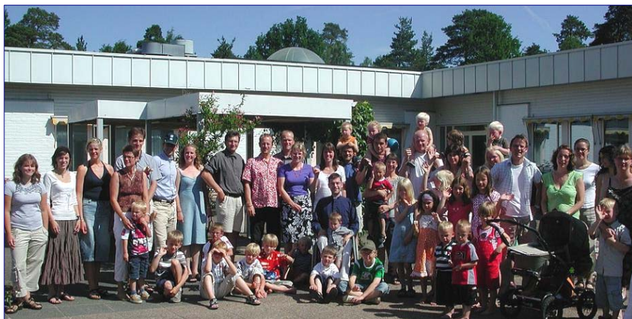
Deltagare på 2006 års familjehelg

Lundbyvägen 12 544 33 HJO Tel: 0503-323 00 Fax: 0503-323 10 Hemsida: www.folkhogskolan.com E-post: info.hjo@folkbildning.net