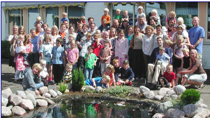
Deltagare på 2007 års familjehelg